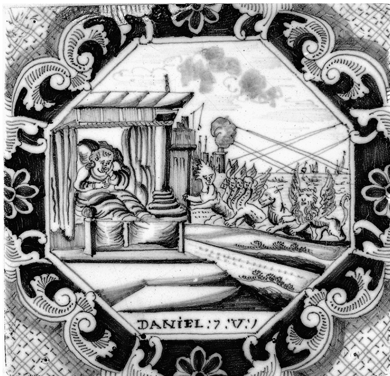
O287: Daniels Traumgesicht von den vier Tieren, Daniel 7, 2-3

Um nicht bei der grauen Theorie stehen zu bleiben, möchte ich meine Betrachtungen auf zwei exemplarische Szenarien anwenden, namentlich auf die Diagnose des sogenannten „Klimanotstandes“ durch die Klimaprotestbewegung „Extinction Rebellion“ (a) sowie auf den Mythos vom „Großen Austausch“, wie er in der „Neuen Rechten“ gepflegt wird (b). Ich wähle diese Beispiele aus, da sich dar-