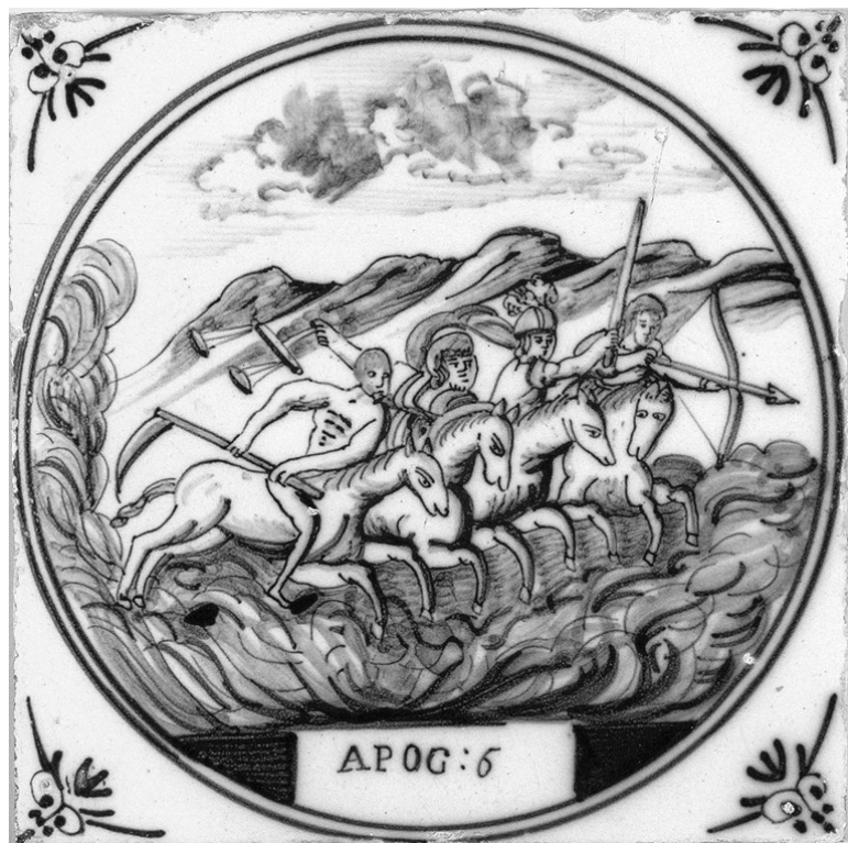
N262: Die vier apokalyptischen Reiter, Offb. 6, 1–2

Sowohl die klassischen als auch die klassisch-modernisierten Apokalypsen enthalten ein grandioses Versprechen der Erneuerung .