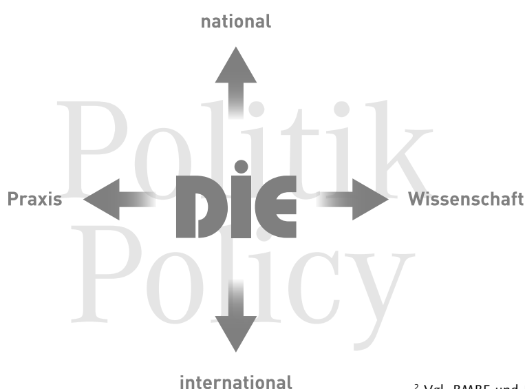
Abb. 2: Mittlerrolle des DIE (DIE, 2013, S. 11) 4

der Dekade in einem Grundsatzpapier Ziele festlegen sowie ein Arbeitsprogramm entwickeln. 2 Das DIE unterstützt die Nationale Dekade für Alphabetisierung und Grundbildung auf verschiedenen Ebenen: Der Wissenschaftliche Direktor des DIE ist in den Wissenschaftlichen Beirat der Dekade berufen worden und berät Bund und Länder; das DIE ist als ein Partner der Dekade im Kuratorium vertreten und in die Fortschreibung des Arbeitsprogramms und die Festlegung der Schwerpunkte der Dekade eingebunden. Zudem unterstützt das DIE die Umsetzung der Dekade durch anwendungsrelevante und grundlagenbasierte Forschungsvorhaben, wissenschaftliche Dienstleistungen und die Entwicklung innovativer Praxiskonzepte. 3